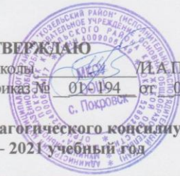
График плановых заседаний психолого-педагогического консилиума МКОУ ООШ, с. Покровск на 2020 – 2021 учебный год